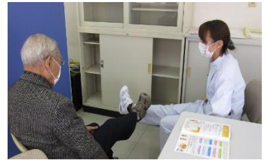
フレイル予防教室の様子