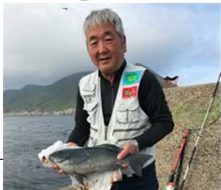
疑惑の50センチ、えっ？