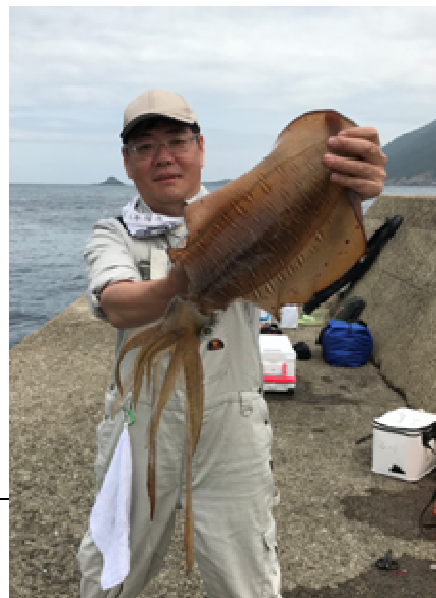
公約通りの大アオリ