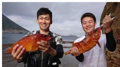
最後の最後にR2、よかったね