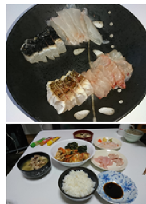
R2の食卓、奥にもう一つ ごはん茶碗。女の影？

紙面で紹介した以外にも結構みんな釣っており、今回も楽しい釣行となった。後日R2がやってきて嬉しそうに料理した魚の写真を見せてくれたので紹介する。なぜほとんど釣りをしたとのなかった彼がついてくるのか、ほんとに來たいのか、なにかたくらみがあるのでは、などと勘ぐっていたが、その姿を見て本当に楽しんでいることが分かつた。