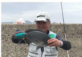
寝た子も起こすぜ