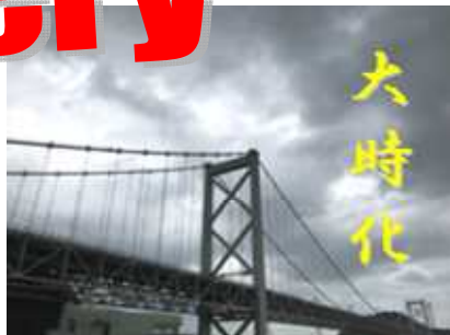
でも、あすはいい天気 ♥