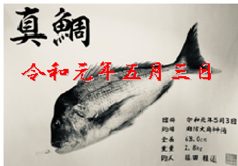
どさくさまぎれ、周防大島神浦 63号、ハリス1号～筆者