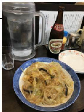
皿うどん、ソースでどうぞ