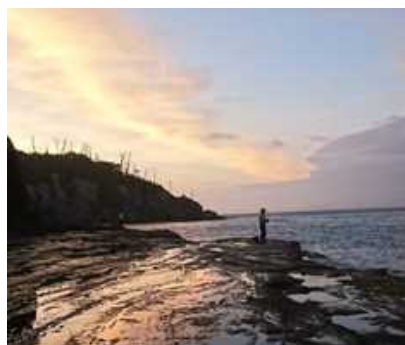
千畳敷のタマヅメ、やはり尾長が

これまでの経験も踏まえると千畳敷はルーア釣りには最適だがカゴにはやはり不向き。潮に洗われて釣りができない満潮前後の時間帯をいかに過ごすか、その日の潮によってあらかじめ計画を立てておく必要がある。それからアオリイカの情報が乏しいので、波止の外向きテトラで誰か大イカにチャレンジしてはくれまいか。