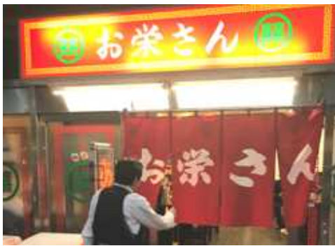
またきたぜ、お栄さん

明るいうちに佐世保に着き、半年 ぶりに「お栄さんの暖簾をくぐった。 絶品のちゃんぽんと、今回はぱりぱり の皿うどんもふたりで二皿注文した。 ちゃんぽんを食べた後に手を付けた皿 うどんは、すでに満腹だったためか特 別な感動はなかった。最終備品調達の ためかめやとセブンに寄り道したが、 それでも九時前にはばらもんに到着 した。二階の寝所には はありがたいことに 焼酎に氷まで用意 していただいた。