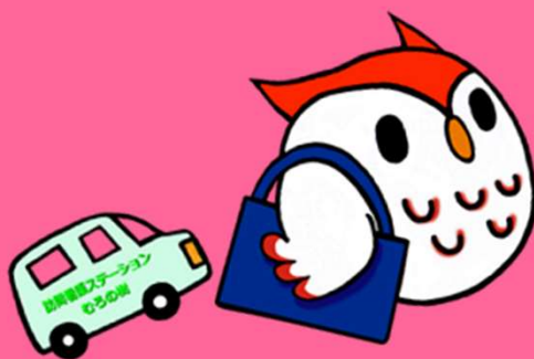
むろの樹マスコット 福 朗